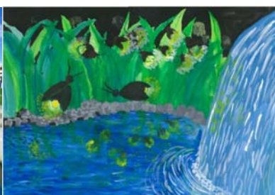
『やさしい光』谷川 生馬 様