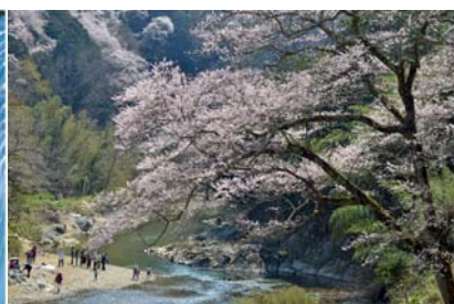
『エドヒガン桜の咲く頃』宮原 昇 様