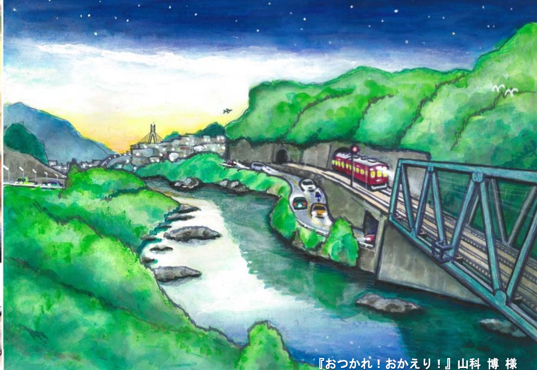
『おつかれ！おかえり！』山科 博 様