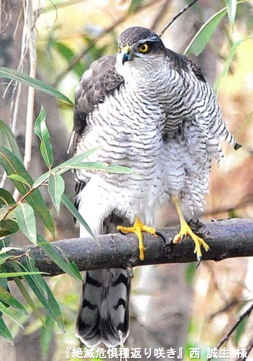
『絶滅危惧種返り咲き』西 誠生 様