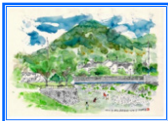
『猪名川風景』 (大音 恭豊さん)