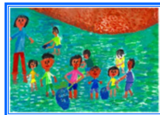
『いっぱいあそんだよ』 (中村 咲月さん)