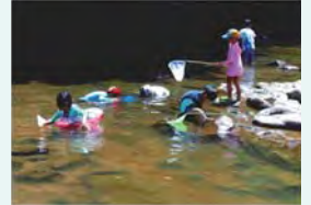
「お魚がいっぱいいるよ!」 なるいし のりお 鳴石 典央さま