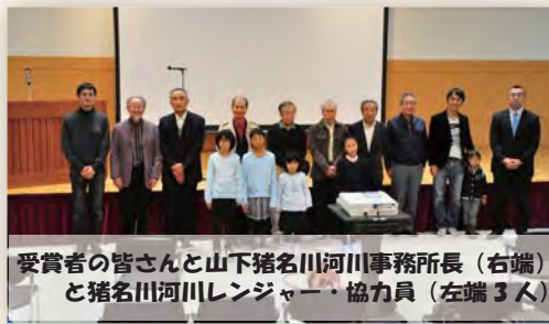
受賞者の皆さんと山下猪名川河川事務所長(右端)と猪名川河川レンジャー・協力員(左端3人)

猪名川河川レンジャーは、より多くの人に猪名川の魅力を知っていただくごと、毎年、猪名川流域の様々な魅力を表現した写真・絵画を募集し、応募作品の展示を行っています。第5回目となる今年度の「猪名川のい〜な!」では、総勢76名の皆様から「大スキ いな川」をテーマにしたとても素敵な作品をご応募いただきました。