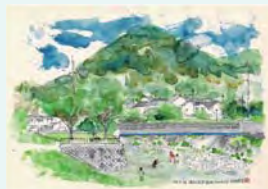
「猪名川風景」 おおと やすとよ 大音 恭豊さま