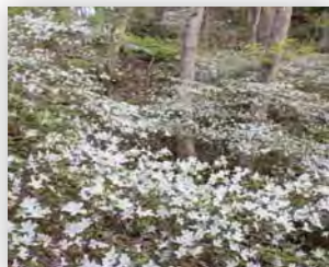
シロバナウンゼンツツジの群落