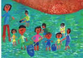
「いっぱいあそんだよ」 なかむら さつき 中村 咲月さま