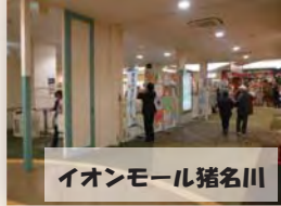
イオンモール猪名川